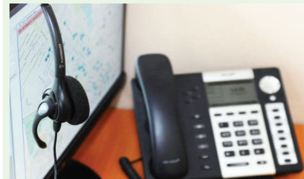
Ангрэн шаҳри, «Дорилфунун» маҳалласи