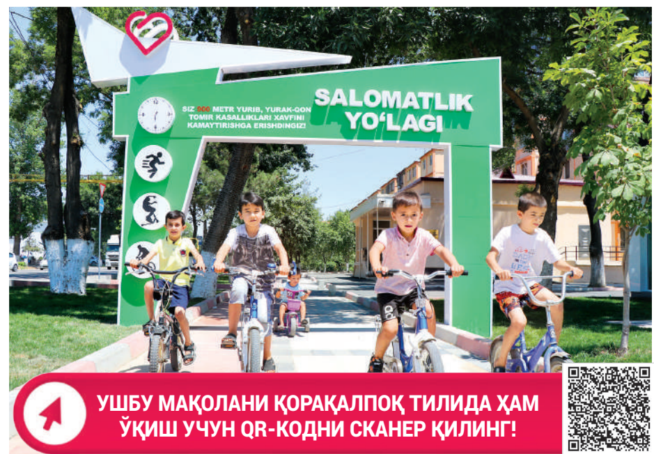
УШБУ МАҚОЛАНИ ҚОРАҚАЛПОҚ ТИЛИДА ҲАМ ЎҚИШ УЧУН QR-КОДНИ СКАНЕР ҚИЛИНГ!

Табиийки, бу чора-тадбирлар ва эзгу мақсадга йўналтирилган лойиҳалар табиатни эъозлаш, унинг ҳар бир неъматидан тежаб-тергаб фойдаланишга қаратилгани билан аҳамиятли. Зеро, давлатимиз раҳбари таъкидлаганидек, табиатни асраш бу — инсонни, келажакни асраш демокдир.