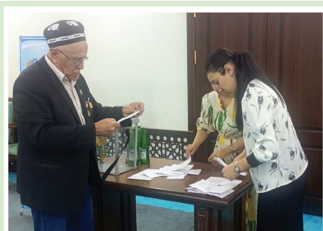
Инсон учун иш жойидаги муҳит, ўзига нисбатан муносабат ва ишонч шунчалик муҳимки, бу ҳолат кўп жиҳатдан унинг яшашга бўлган қарашини ҳам белгилаб беради. Бухорода жорий йилнинг февраль-апрель ойларида ўтказилган ҳисобот-сайлов йиғилишлари ва конференциялари айнан шундай ишонч, бирдамлик ва ҳамжиҳатлик муҳитини янада чуқурроқ намоён этгани билан аҳамиятли бўлди.