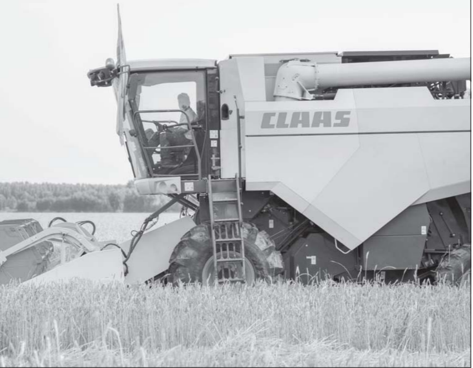
Соли ҷорӣ дар 94 ҳазору 300 гектар майдони вилояти Фарғона «Асп», «Давр», «Вежа», «Антонино», «Алексеевич» ва «Базостая-100» – навъҳои серҳосил ва пешпазаки галларо парвариш карданд.

Алҳо мавсими дарави галла оғоз ёфт. Пеш аз оғози дарав дар ноҳияи Ёзёнов бо иштироки ҳокимони ноҳияҳо, мутахассисони соҳа семинари намоишӣ ташкил шуд. Иштироки аввал бо рафти тайёрии ҳосилгундорию хоҷагии фермери «Баҳромҷон»-и ҳудуди Фарғонаи марказӣ шинос шуданд ва ба оғози галладаравӣ старт доданд. Сипас, таҷрибаи хоҷагии фермери «Мизон»-ро, ки дар асоси истифодаи технологияҳои Чин ба нишондоди баланд ноил гардидааст, аз назар гузарониданд. Дар семинар оммави гардондани таҷрибаи хоҷагии номбурда дар ҳудудҳо таъкид гардид.