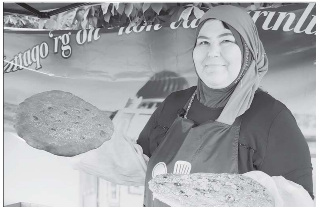
Дар акс: лаҳзае аз тадбир.

Бояд гуфт, ки ҷангоми баргузорию тадбири мазкур нонпазо дар 20 танӯр аз бисёр вилоятҳои кишварамон чанд намууди нону фатир пухта, пешкаши меҳмонону мизбонон карданд. Ҳозирон, хосатан сайёҳони хориҷӣ онҳоро бо иштиҳо тановул намуда, ба маҳорати нонпазо баҳои баланд доданд. Дар озмуни «нонпази ку-