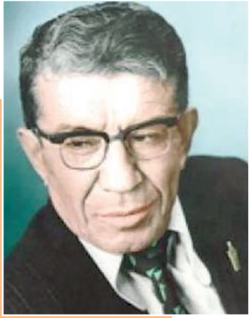
Тўра СУЛАЙМОН, Ўзбекистон халқ шоири