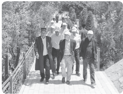
Қашқадарёдаги "ЛАНГАР ОТА" МАСЖИДИ АҚШ элчихонаси маблағлари ҳисобидан қайта таъмирланди.