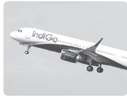
"IndiGo" авиакомпанияси 1 августдан "МУМБАЙ-ТОШКЕНТ-МУМБАЙ" йўналиши бўйича мунтазам қатновларни амалга оширади.