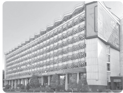
Ўзбекистон "Mobiuz" алоқа операторини ХАЛҚАРО СОТУВГА ҚЎЙДИ. Аризалар 1 августгача қабул қилинади.