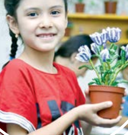
Ватанни чуқурроқ англаш имкони

Бундан ташқари, маданият, илм-фан ва бизнес соҳалари намоёндалари иштирокида маҳорат дарслари, хунарманда, театр ва кино ижодкорлари билан мулоқотлар бўлади.