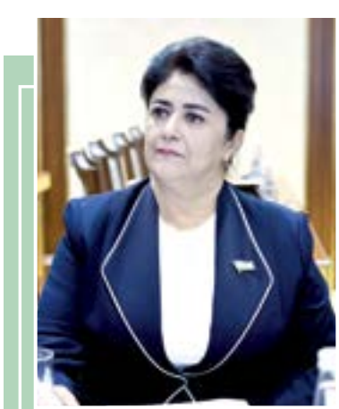
Жамила БОБОНАЗАРОВА, Олий Мажлис Сенати аъзоси

Дунёдаги турли можазолар, ўзаро низолашувлар, қуролли тўқнашув ва савдо урушлари туфайли жаҳон иқтисодиёти жиддий зарар кўрмоқда. Бу, ўз навбатида, миллионлаб замондошимизнинг тўғри овқатланиш, соғлигини тиклаш, сифатли таълим олиш билан боғлиқ зарур ҳаётий эҳтиёжларини таъминлашга салбий таъсир кўрсатмоқда. Ана шундай мураккаб шароитда барқарор тараққиётга эришиш инвестицияларга боғлиқ бўлиб қоляпти. Инвесторлар ҳам бундай мавҳум вазиятга тинч, ўз танлаган тараққиёт йўлидан оғишмай бораётган давлатларга сармоя йўналтираётгани айни ҳақиқат.