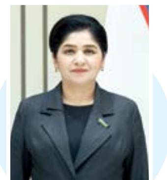
Малика ҚОДИРОВА, Олий Мажлис Сенати аъзоси

Давлатимиз раҳбарининг ушбу кунларда йўллаган иккита табриги ҳар томонлама диққатга сазовор. Биринчисида Президентимиз Қурбон ҳайити муносабати билан юртдошларимизни чин қалбдан табриқлади. Унинг тинчлик ва меҳр-оқибат байрами эканига эътибор қаратиб, халқимиз орасида тараққий этаётган хайрия, эҳсон ва шафқат муҳитини ривожлантириш зарурлигини алоҳида таъкидлаб ўтди.