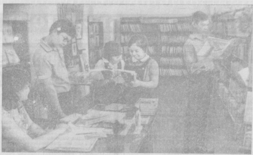
НА СНИМКЕ: в отделе обслуживания школьников 4—5 классов.

РЕСПУБЛИКАНСКАЯ детская библиотека — одна из крупнейших в республике — имеет около четырех тысяч читателей. Ее фонд состоит из 80 тысяч книг: художественной, научно-технической и другой литературы. Здесь трудятся 58 опытных библиотекарей. Ведется большая методическая работа по оказанию помощи всем городским и сельским библиотекам Узбекистана, организуются семинары, работают курсы по повышению квалификации библиотечных работников.