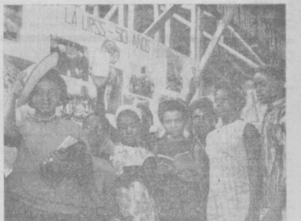
ЭКВАТОРИАЛЬНАЯ ГВИНЕЯ. Большим успехом у жителей Санта-Исабель и Бата пользовались фотовыставки, посвященные 50-летию образования СССР. Многие из этих фотографий рассказали об истории образования Советского государства, жизни братских республик, достижениях советской науки и техники, развитии искусства и спорта. Для посетителей экспозиции ежедневно демонстрировались короткометражные фильмы. НА СНИМКЕ: посетители фотовыставки в городе Бата.

Участники собрания направили приветствие иное письмо в Дакку, в адрес общества дружбы «Бангладеш — СССР».