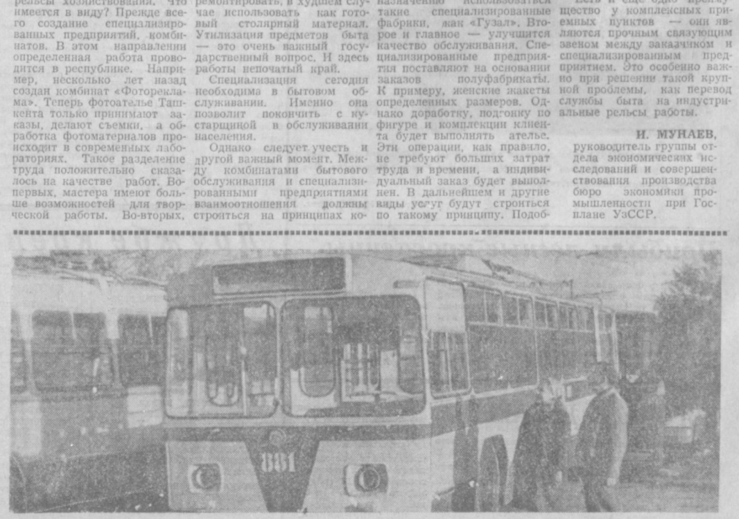
В троллейбусное депо № 2 из города Энгельса поступили 16 комфортабельных машин. Салон нового троллейбуса имеет три входные двери, торможение его гидравлическое. НА СНИМКЕ: новые троллейбусы, готовые отправиться на городские маршруты.

Сейчас, наверное, трудно найти человека, которому бы не доводилось пользоваться услугами службы быта. Оно и не удивительно: предметом обихода у людей становится все больше, и порой из-за малейшей несправности пользоваться им нельзя. Вот и идет человек за помощью к службе быта. Но не всегда остается он доволен качеством обслуживания.