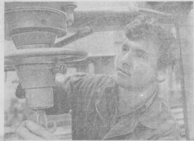
Ударно несет юбилейную вахту коллектив Ташкентского ордена Трудового Красного Знамени оптико-ремонтно-механического завода объединения «Узсельхозтехника». В социалистической соревновании среди коллективов родственных предприятий он два раза в этом году выходящий победителем. И в настоящее время у него находится переходящее Красное знамя объединения «Союзсельхозтехника».