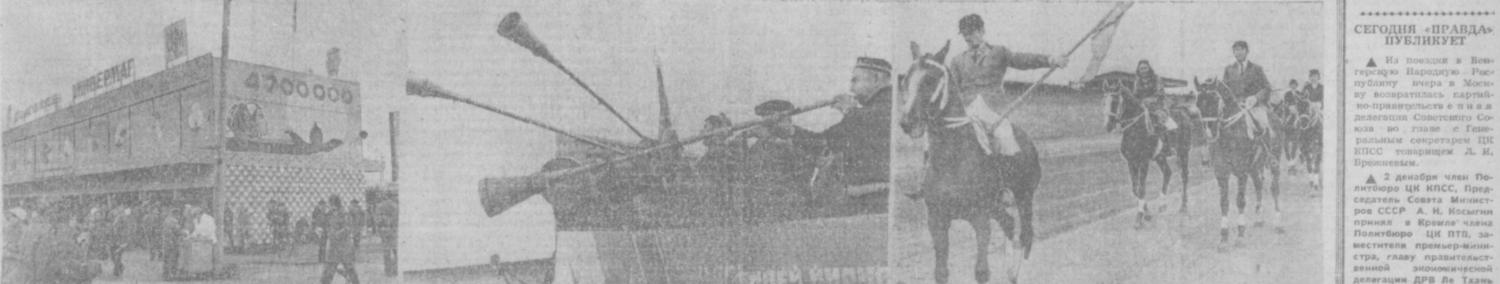
НА СНИМКАХ: «ПРАЗДНИК УРОЖАЯ» НА ТАШКЕНТСКОМ ИППОДРОМЕ.

Беседа проходила в обстановке сердечности и братства.