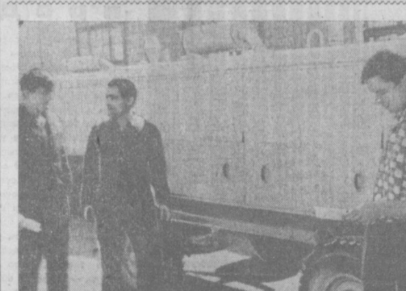
ТАШКЕНТСКИЙ ЗАВОД «КОМПРЕССОР». Большим спросом в стране и за рубежом пользуются компрессорные станции предприятия, в том числе компрессоры ротационного действия. Последняя модель завода «ПР-10М» удостоена большой золотой медали Лейпцигской международной осенней ярмарки 1972 года.

В опытно-конструкторском бюро по радиоаппаратуре успешно создан оригинальный автомат для расфасовки различных пачек, предприятий страны. Коллектив конструкторов выполнил задание в срок — 2.400 банок в час. Автомат успешно прошел испытания, и его изготовление и освоение начато в цехе № 50.