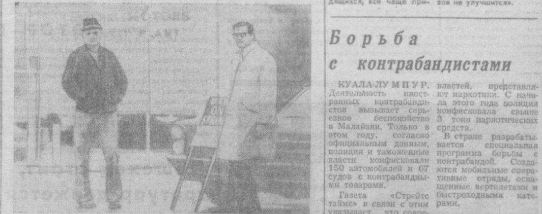
В Соединенных Штатах продолжают широко выступать трудящиеся за свои права.

БОНН. Нарастающая конкуренция со стороны крупных строительных концернов ряда западных стран влечет за собой, как подчеркивают газеты, «все новые трудности» для судостроительной промышленности ФРГ. При этом предприниматели сталкиваются с трудностями на плечи трудящихся, все чаще при-