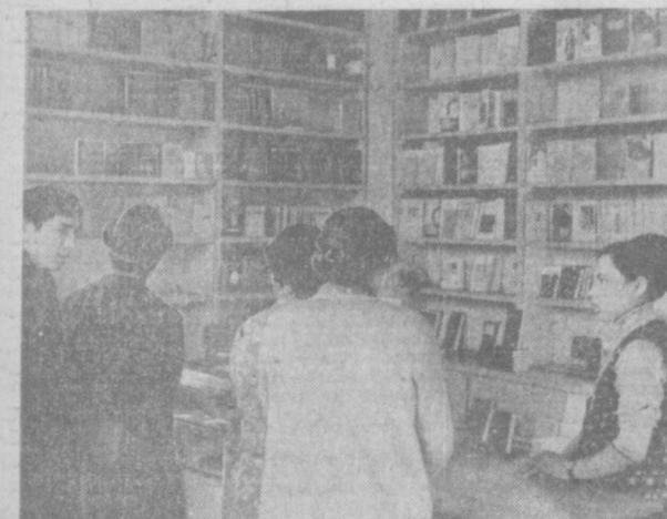
Любовь к книгам повсеместна, ими увлекаются все. В Ташкенте десятки книжных магазинов, самый крупный из них — пассаж на улице Алишера Навои.

Еще недавно эта сторожевая башня — точная копия старшей в 1899 году и вновь построенной в начале XX века — возвышалась в селе Торговище.