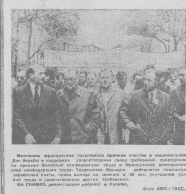
Миллионы французских трудящихся приняли участие в национальном Дне борьбы в поддержку удовлетворения своих требований, проведенном по призыву Всесоюзной конфедерации труда и Французской демократической конфедерации труда. Трудящиеся Франции добиваются повышения заработной платы, права выхода на пенсию в 60 лет, улучшения условий труда и удовлетворения других требований. НА СНИМКЕ: демонстрация рабочих в Париже.

Сейчас в городе Веспергерской Народной Республики широко используется опыт Советского Союза в области индустриального жилищного строительства. Шесть из восьми действующих в стране домостроительных комбинатов построены по советским проектам, оснащены советским оборудованием. Из готовых железобетонных конструкций, выпускаемых этими предприятиями, собирается седьмой домостроительный комбинат. В этом году из готовых заводских конструкций в стране предполагается построить 19 тысяч новых квартир, в предстоящем пятилетии ежегодно будет сооружаться 35 тысяч квартир.