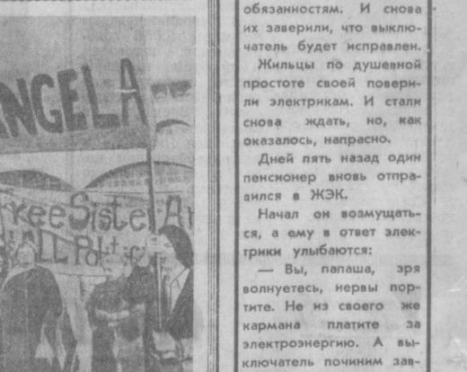
США. ЛОЗУНГ «СВОБОДУ АНДЖЕЛЕ» СТАЛ ОСНОВНЫМ ВСЕЙ ПРОГРЕССИВНОЙ АМЕРИКИ. ЛЮДИ РАЗНОГО ВОЗРАСТА И ЦВЕТА КОЖИ, РАЗНЫХ ПОЛИТИЧЕСКИХ ВЗГЛЯДОВ И ПРОБЛЕМЫ ВСТАЛИ НА ЗАЩИТУ МУЖЕСТВЕННОГО БОРЦА ЗА ГРАЖДАНСКИЕ ПРАВА НЕГРОВ.

НЬЮ-Йорк. Около 500 профессоров и преподавателей калифорнийского университета приняли резолюцию, в которой выражается протест против участия университета в выполнении заказов Пентагона и центрального разведывательного управления США. «Участие университета в секретных исследованиях должно быть немедленно прекращено», — подчеркивается в резолюции, принятой после рассмотрения специального доклада о пагубных последствиях милитаризации для учебной и научной деятельности одного из самых крупных высших учебных заведений в стране.