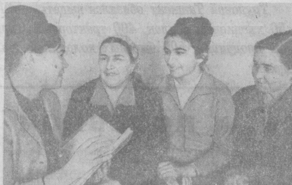
Большую работу среди родителей проводит учителя школы № 73.