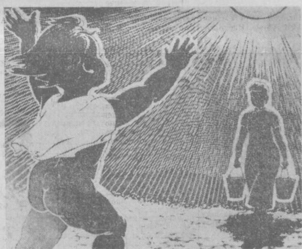
Пусть всегда будет солнце... Фотопроизведения с картин монгольского художника Амгалан.

«Построить за счет государственных капитальных вложений общеобразовательные школы не менее чем на 6 млн. мест, значительно увеличить сеть пришкольных интернатов для учащихся на селе. Существенно улучшить внешкольную работу с детьми, расширить сеть домов пионеров, станций