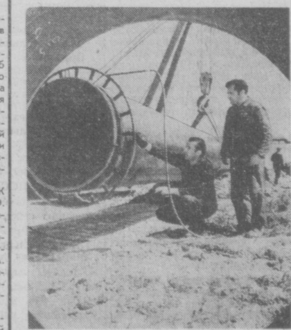
Строительство чехословацкого участка международного транзитного газопровода, который связывает Советский Союз с некоторыми странами Западной Европы, является крупнейшей социалистической стройкой пятилетия в СССР. На трассе чехословацкого участка предстоит уложить 600 тысяч тонн труб большого диаметра, которые поставят СССР и ГДР. НА СНИМКЕ: идет укладка газопровода.

КАИР. Комитет по разработке проекта конституции Федерации арабских государств — ОАР, Сирии и Ливии — закончил разработку проекта конституции. Целью Федерации, говорится в этом документе, являются объединение арабских стран в интересах борьбы за ликвидацию последствий израильской агрессии, освобождение, за достижение арабского единства и повышение жизненного уровня народов стран-членов Федерации. Согласно проекту конституции, высшей исполнительной властью Федерации будет президентский совет, а законодательной — национальное собрание. ДЕЛИ. В Индии имеет место быстрый рост населения. Согласно данным проведенной недавно переписи за десять лет — с 1961 по 1971 год — население Индии увеличилось на 24,57 процента. Это наибольший прирост населения со времени первой переписи в Индии — в 1901 году. По данным переписи, население Индии на 1971 год составляет 547 млн. человек. (ТАСС).