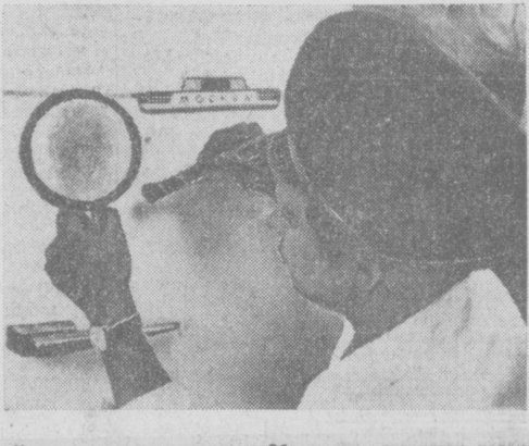
Невидимое стало видимым. Обнаружен отпечаток пальца.