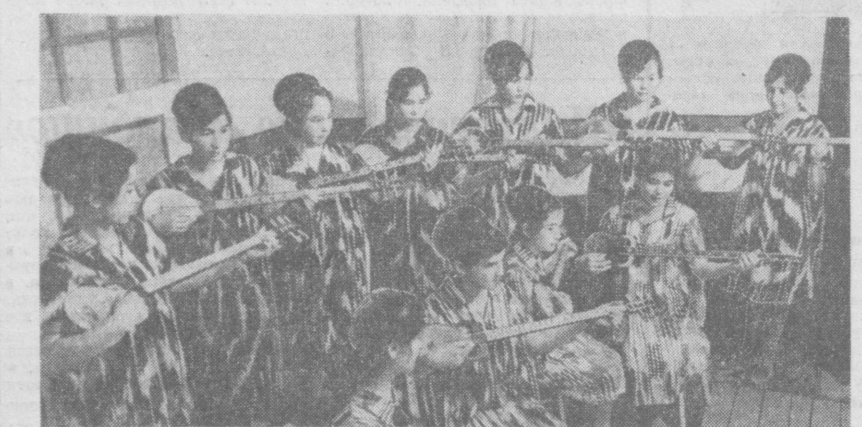
ХОРЕЗМСКАЯ ОБЛАСТЬ. В Хивинском педагогическом училище создан ансамбль песни и танца «Гулдаста». В новом творческом коллективе с увлечением занимаются 30 юношей и девушек. Ансамбль уже успешно выступал на телевидении, в колхозах и совхозах. Руководит этим самостоятельным коллективом заслуженный артист УзССР Юсуп Днаббаров.

Радно СРЕДА — 2 ИЮНЯ ПЕРВАЯ ПРОГРАММА 16.10 Творчество композиторов Узбекистана. А. Мухамедов. 16.50 Обзор газеты «Правда» (узб.). 18.00 Передача «Источники вдохновенного труда» (рус.). 18.10 Г. Савитов. «Памирская сюита». 18.40 Спортивная передача (рус.). 19.20 Казанская музика. 20.00 Радиожурнал «Узбекистон инициативы». 20.30 Концерт для работников промышленности. 21.00 Комментарий на международные темы (узб.). 21.10 Передача и концерт для работников сельского хозяйства. 22.20 Поет народная