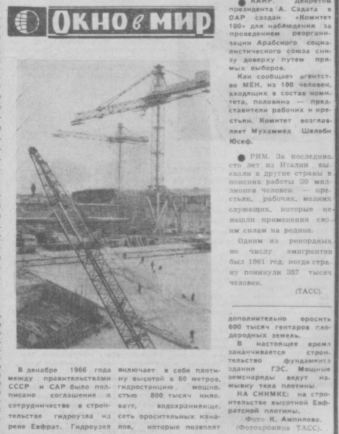
ОКНО В МИР

С напутственным словом и участливым делегацией республиканца на V Спартакиаде народов Узбекской ССР обратился второй секретарь ЦК Компартии Узбекистана В. Г. Ломоносов.