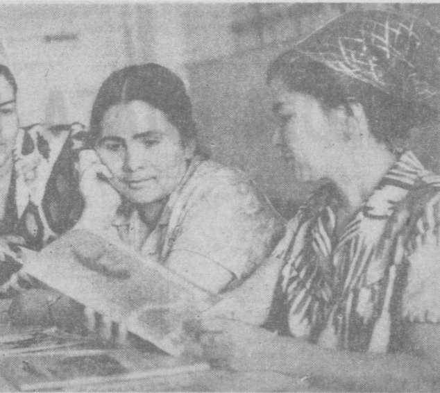
Хорошо построена работа с избирателями и агитунитом Ташкентского избирательного участка № 18.

В Узбекиском обществе дружбы и культурной связи с зарубежными странами состоялась заседание правления Узбекского отделения Общества советско-венгерской дружбы.