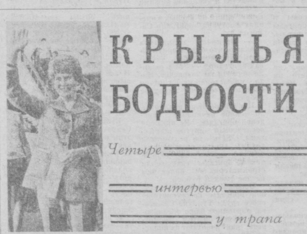
Пилотесса в форме.

Четыре интервью у трапа Сейчас они или разглядывают каталожную табличку в гостинице «Мест лет», или вступают в местный альпийский клуб «Дикарей». А может, наоборот, сидят, обласканные деловым черноморским санаторием. Отпускники. С ними сегодня утром я познакомился в Ташкентском аэропорту. Они не могли транскрипировать свое отправление и поэтому спешили почувствовать себя на крыльях. Понятно, лайнера. Пробунд динамик, пригласив на посадку тех, кто вылетает в Симферополь. Они начались сразу же у трапа. Подшел человек в летной форме, приподнял.