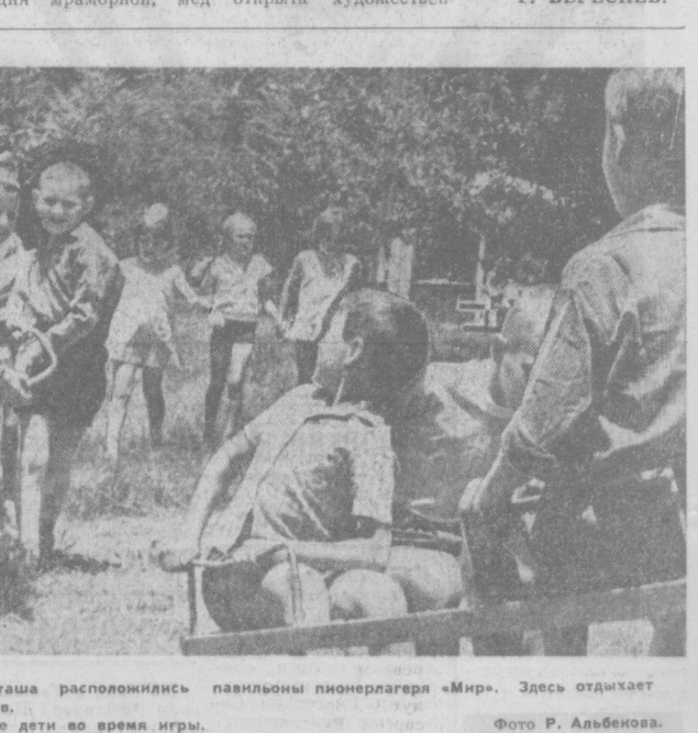
В живописном уголке Акташа расположились павильоны пионерлагеря «Мир». Здесь отдыхает более 400 детей ташкентцев. НА СНИМКЕ: отдыхающие дети во время игры.