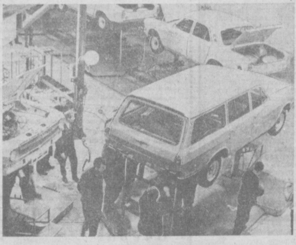
ГОРЬКИЙ. С конвейера Горьковского автозавода сошла первая «Волга» «М-24-02» типа «Универсал». Эта семиместная машина может служить и для перевозки груза. В этом случае два ряда сидений складываются, и на их месте образуется площадка. Усиленные рессоры «Универсала» позволяют брать груз до 600 килограммов. Отличная вентиляция, отопление кузова, удобство сидений, мягкость хода и многое другое — все это так же выгодно отличает новую «Волгу» от прежних моделей. До конца года завод изготовит первую партию машин, что будет началом серийного производства «Универсала». НА СНИМКЕ: «Волга»-«Универсал» на конвейере цеха сборки легковых автомобилей.