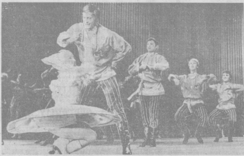
НА ФЕСТИВАЛЕ искусств народов СССР, посвященном 50-летию образования Советского государства, большим успехом у парманов пользовались выступления артистов Красноярского ансамбля песни и пляски. НА СНИМКЕ: в вихре танца.