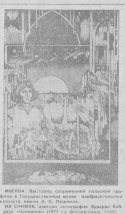
МОСКВА. Выставка современной польской графики в Государственном музее изобразительных искусств имени А. С. Пушкина.

ВИНО ИЗ КАКАО ЛАГОС. Вино, изготовленное из какао, не уступает по вкусовым качествам натуральному виноградному вину. К такому выводу пришли еще в 1965 году эксперты министерства торговли Нигерии. Однако прошли годы, прежде чем двое молодых ученых из Юго-Восточного штата Нигерии окончательно отработали и запатентовали технологию изготовления вина из какао. Правительство Юго-Восточного штата планирует выделить 800 тысяч нигерийских фунтов на строительство пяти технологических предприятий нигерийских специалистов) завода по производству этого необычного вина производительностью 2,5 миллиона бутылок в год. Из-за рубежа уже поступили заявки на новый продукт.