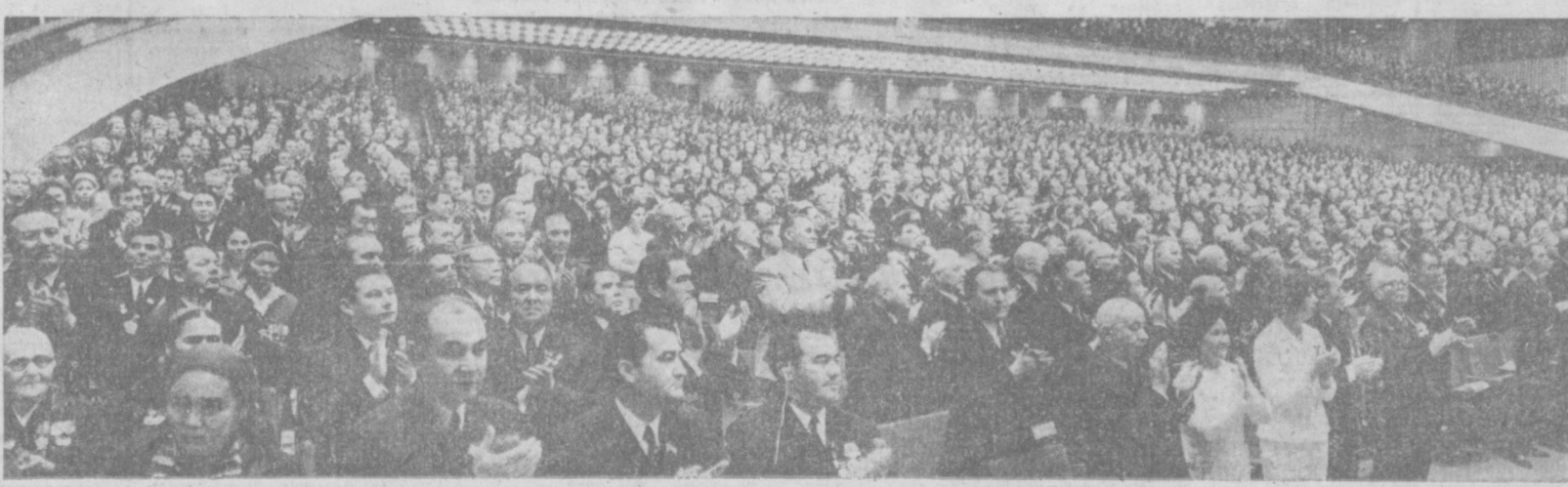
В зале заседаний Кремлевского Дворца съездов.

Встречи проходили в атмосфере сердечной дружбы и полного единства взглядов.