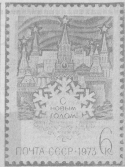
Министерство связи СССР выпустило почтовую марку «С новым годом!».