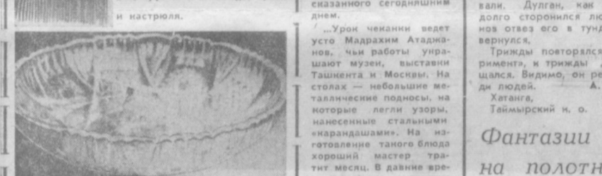
НА СНИМКАХ: чайный сервиз, хрустальное блюдо, сумка и кастрюля.

СУМОЧКА С БАХРОМОЙ Модная молодежная сумка из велюра — на длинной ручке, отделанная бахромой, ремешками и блестящей фурнитурой. Это новинка производства Ташкентской конгломератной фабрики. Предприятие уже передало в торговлю первую партию таких изделий. В будущем году выпустит 500. Цена сумки — 3 рубля 20 копеек.