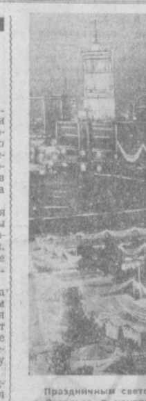
Праздничным светом разноцветных огней залита площадь имени Маркса и Энгельса в центре Берлина. В столице ГДР открылся предновогодний базар.

Польские трудящиеся и коммунисты, подчеркивается в статье, имеют все основания для того, чтобы великую годовщину образования Советского Союза отмечать как свой собственный праздник.