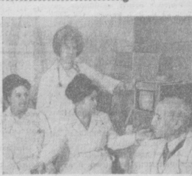
Хорошим помощником медиков в комплексном исследовании больных с сердечной патологией стал аппарат физиограф.

Заболевание проявляется не сразу: от начала заражения до первых признаков о (скрытый период) проходит 3—5 недель, иногда и больше. Первые признаки выражаются общим недомоганием, слабостью, понижением или отсутствием аппетита, тошнотой, иногда рвотой, чувством тяжести в верхней половине живота, головной болью, головокружением, нарушением сна. У некоторых может быть насморк, кашель, небольшая боль в горле, боли в суставах рук и ног. Температура при этом может быть нормальной или повышенной до 37,5—38 градусов. Увеличивается и становится чувств-