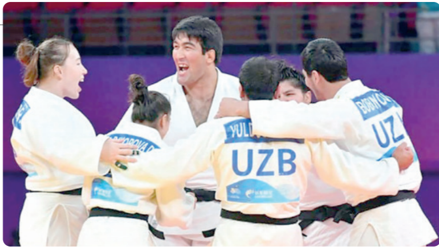
Венгрияда дзюдо бўйича КАТТАЛАР ЎРТАСИДАГИ ЖАҲОН ЧЕМПИОНАТИ да 18 нафар ўзбекистонлик спортчи қатнашади.