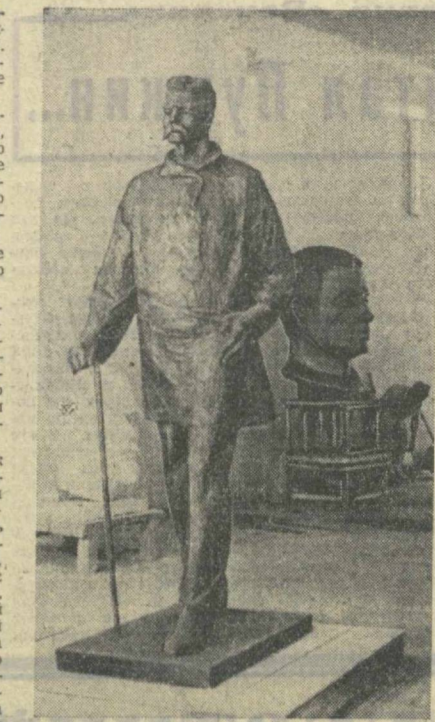
Фигуры великого пролетарского писателя. Следовательно, впереди интересные работы и новые творческие удачи.

2. Не смотреть на ослепительные фары идущих навстречу ма-