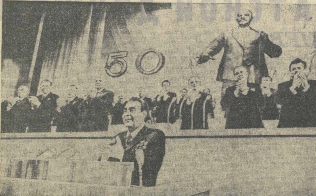
КИШИНЕВ, 11 октября. Выступление Л. И. Брежнева на торжественном заседании.

ОРГАН ТАШКЕНТСКОГО ГОРКОМА КП УЗБЕКИСТАНА И ТАШГОРСОВЕТА