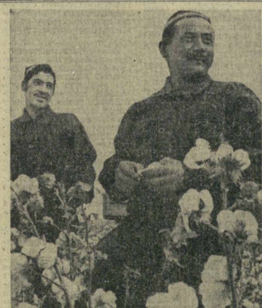
Достойными трудовыми подарками встречают труженики сельского хозяйства республики свой праздник. На полях выращен богатый урожай хлопка и других сельскохозяйственных культур, успешно идет сдacha государству «белого золота».

обмене квартир, продаже имущества, утере документов и т. д. Напомним вам, дорогие читатели, продолжается подписка на рекламное приложение. Индекс 64537, цена годового подписки 2 р. 08 к.