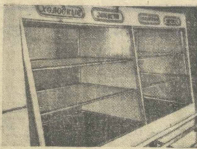
РЕЙД ГАЗЕТ «ВЕЧЕРНИЙ ТАШКЕНТ» И «ТОШКЕНТ ОКШОМИ»

Все это говорит о том, что районные тресты столовых ослабили контроль за работой пред-