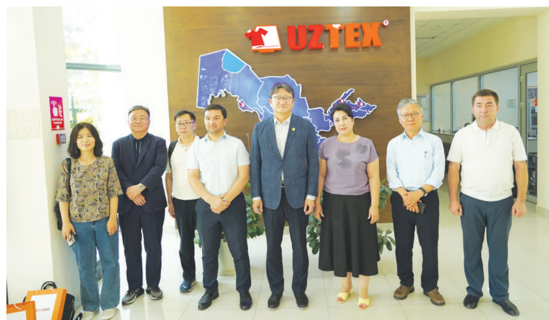
Кунинг иккинчи яримиде «Ижтимоий мулоқотни янада ривожлантириш ва мустаҳкамлаш» мавзусидаги кўшма семинар бошланди.