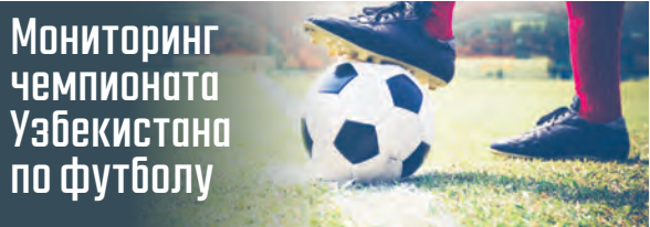
Мониторинг чемпионата Узбекистана по футболу

Победа «Шуртана» над «Сурхоном» в тринадцатом туре произвела переполох в чемпионате. Набрал восемь девять очков, гузарчи приблизились сразу еще к восьми командам, почувствовавшим угрозу вылета из Суперлиги. Они тоже оказались в стане аутсайдеров с отрицательной разницей забитых и пропущенных мячей.