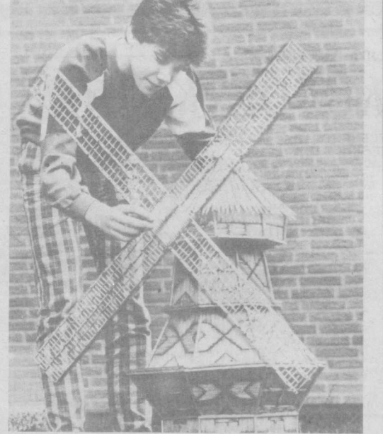
Не выбрасывайте использованные спички... Из 48.000 собранных или выращенных кусочков дерева этот западногерманский школьник в течение месяца построил вот такую красивую ветряную мельницу, высотой в полметра. Внутри сооружения он поместил старые часы, которые при вращении крыльев мельницы наигрывают мелодию.