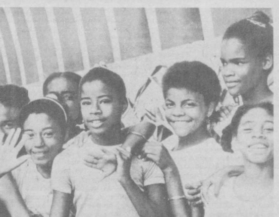
Радость, веселье светятся в улыбках этих кубинских детей: начался новый учебный год.

обучение к потребностям жизни. Большие перемены пришли в новом учебном году и к школьникам Монголии. Дети республикан будут теперь ходить в школу не с рюкзаком, как раньше, а с сумкой, и предостоят им учиться не десять, как раньше, а двадцать лет, в одиннадцатый и двенадцатый классы. И еще: каждая восьмилетняя и десятилетняя школа прикрепляется к базовому предприятию, чей профиль определяется в зависимости от местных потребностей в кадрах.