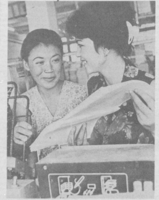
На снимке: девушки в переплетном цехе.