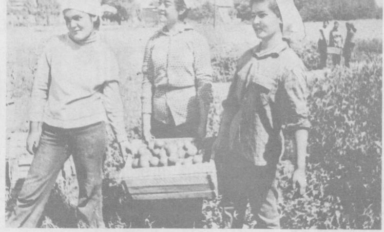
1.200 учащихся Ташкентского педагогического училища имени В. И. Ленина трудятся в эти дни на полях совхоза «Москва» Калининского района, помогая сельским труженикам в сборе урожая овощей.