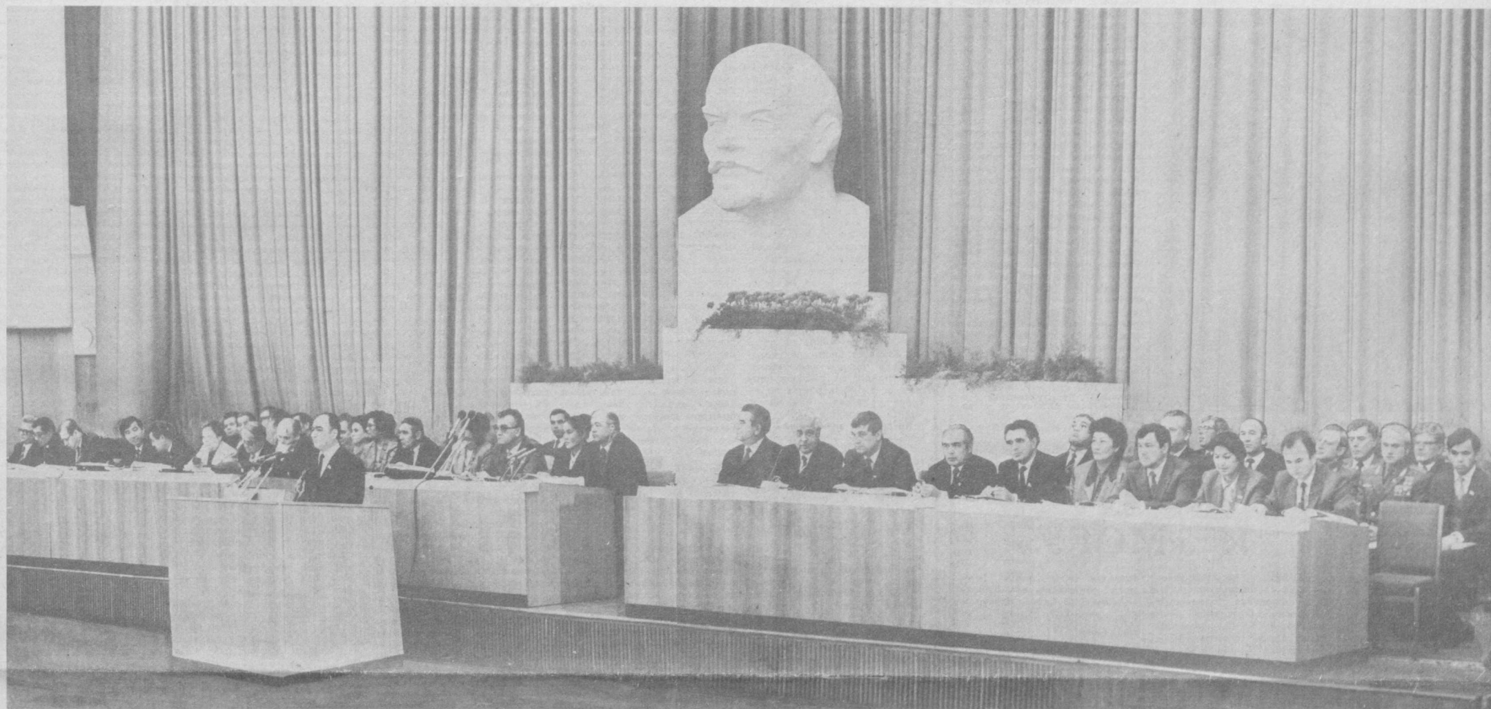
ТАШКЕНТ, 27 октября. Шестая сессия Верховного Совета Узбекской ССР одиннадцатого созыва.