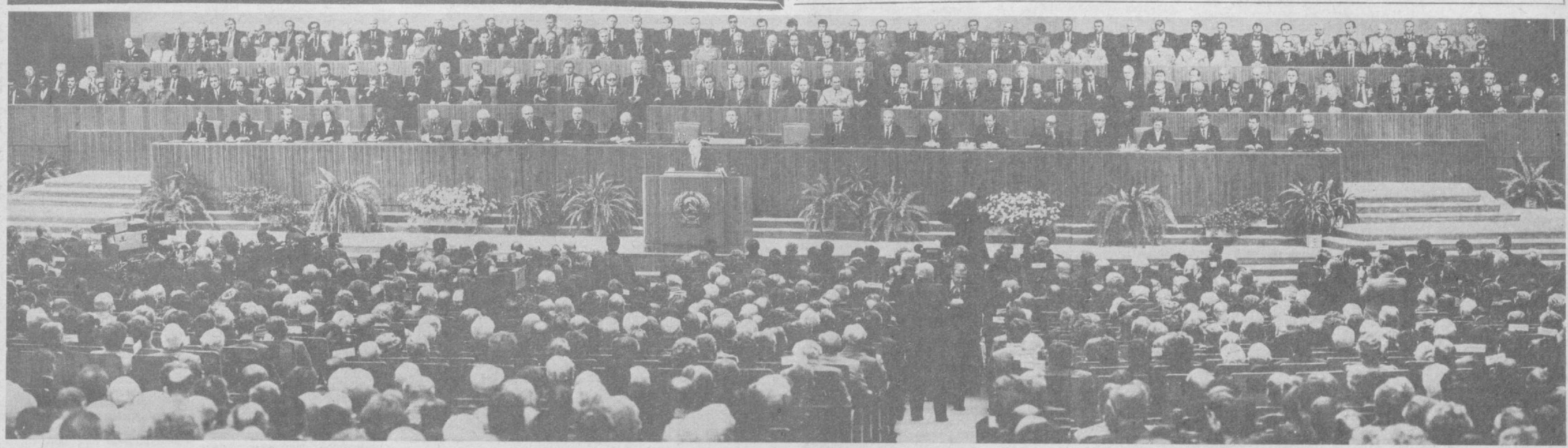
МОСКВА, КРЕМЛЬ, 2 ноября 1987 г. Совместное торжественное заседание Центрального Комитета КПСС, Верховного Совета СССР и Верховного Совета РСФСР, посвященное 70-летию Великой Октябрьской социалистической революции.

С докладом «Октябрь и перестройка: революция продолжается» выступил Генеральный секретарь ЦК КПСС М. С. Горбачев.