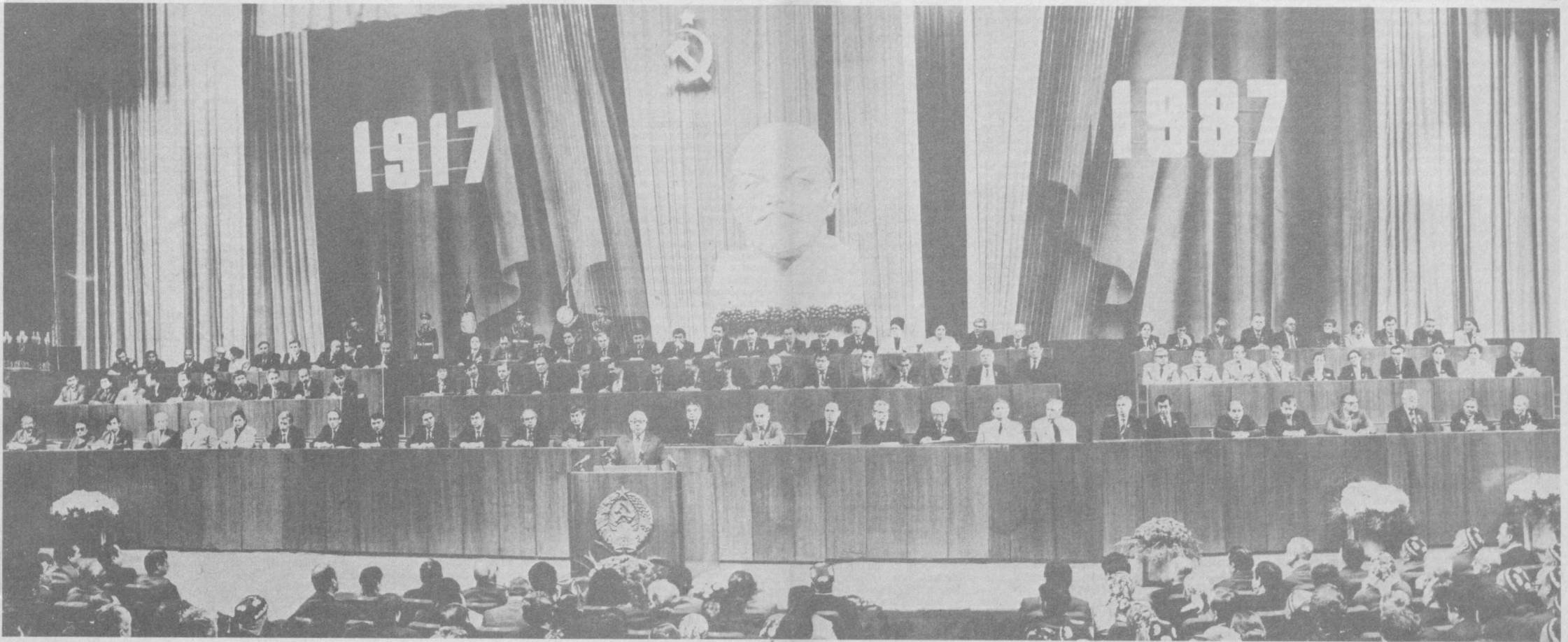
В президиуме совместного торжественного заседания Центрального Комитета Компартии Узбекистана и Верховного Совета Узбекской ССР.

Да здравствует 70-летие Великой Октябрьской со- циалистической револю- ции!