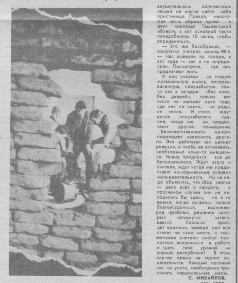
Внушительным количеством людей не могла найти себе пристанища. Правда, некоторая часть обрела приют в двух колхозах Ташкентской области...