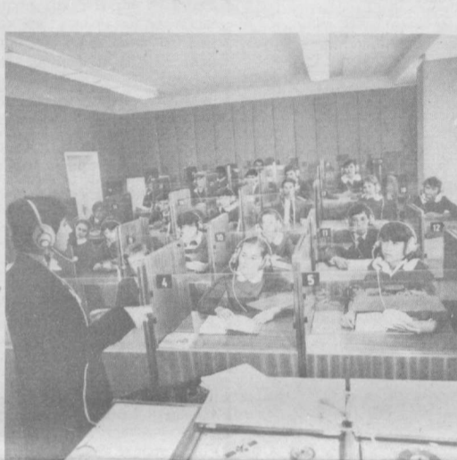
В 1981 году учащиеся школы им. Васила Левского г. Правец в Болгарии начали занятия в новом здании. Оно располагает современной материальной-технической базой.