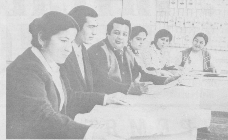
Большое внимание в школе имени Аль-Хорезми города Хивы уделяется улучшению всего учебно-воспитательного процесса. Здесь регулярно проводятся совещания, отчеты учителей. На снимке: очередное заседание методического кабинета учителей.

На снимке: очередное заседание методического кабинета учителей.