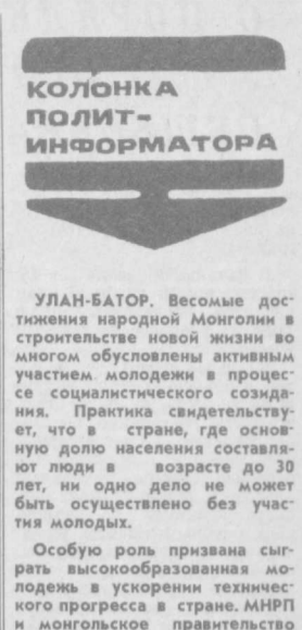
УЛАН-БАТОР. Весомые достижения народной Монголии в строительстве новой жизни во многом обусловлены активным участием молодежи в процессе социалистического строительства. Практика свидетельствует, что в стране, где основную долю населения составляют люди в возрасте до 30 лет, ни одно дело не может быть осуществлено без участия молодых. Особую роль призвана сыграть высокообразованная молодежь в ускорении технического прогресса в стране. МНРП и монгольское правительство принимают многосторонние меры по дальнейшему совершенствованию технического мышления, развитию конструкторского таланта подрастающего поколения. Ныне свыше 20 тыс. юной и девушек занимаются в различных технических кружках и клубах. Важным фактором развития технического творчества в промышленности служит стремление молодых труженников лучше овладеть избранной специальностью. Только за последние два года около 10 тыс. ремесленников повысили свою квалификацию или освоили смежную профессию. ХАРАРЕ. Сотни активистов молодежной лиги правящей в Зимбабве партии ЗАНУ-ПФ прошли колоннами по улицам Хараре в знак солидарности с борьбой патриотов Южной Африки против расистского режима. На массовом митинге в центре города член политбюро партии ЗАНУ-ПФ Нингубе решительно осудил репрессии и террор властей ЮАР против африканцев, из агрессивной политики в отношении соседних государств. Ежедневно жертвами террора в государстве апартеида становятся десятки африканцев, которые не хотят больше мириться с системной расовой сегрегацией, подчеркнул он. Представитель Африканского национального конгресса Южной Африки в Зимбабве Мазимба указал, что кампания протеста против насилия расистского режима охватила практически всю страну. Борьба за свободу Южную Африку принимает всенародный характер. СОФИЯ. Здесь состоялся пленум Центрального комитета Димитровского коммунистического союза молодежи. Первым секретарем ЦК ДКСМ на нем избран А. Бунджов, работавший секретарем ЦК этого союза. Пленум освободил С. Шолову от обязанностей первого секретаря ЦК ДКСМ в связи с избранием ее секретарем Софийского горкома БКП. Пленум рассмотрел также вопросы, связанные с совершенствованием комсомольской работы в школе с учетом требований научно-технического прогресса. БЕЛГРАД. Учащиеся высших учебных заведений Югославии отметили День студентов. Он установлен в память об антифашистских выступлениях студентов Белградского университета, которые произошли ровно 50 лет назад. Их забастовка, поддержанная вузами Загреб и Любляны, закончилась победой. В Белградском университете была расчистлена молодежная фашистская организация, уволен профессорский настроенный ректор. Эти выступления явились важным шагом в развитии революционного молодежного движения в довоенной Югославии. По традиции состоялось встреча студентов с ветеранами революции, представителями других университетских центров, праздничные концерты. НЬЮ-ЙОРК. Массовые студенческие демонстрации в требовании к Вашингтону немедленно прекратить поддержку расистской ЮАР прошли во многих городах США. Они были приурочены к 18-й годовщине со дня убийства борца за гражданские права американских негров Мартина Лютера Кинга. В Нью-Йорке, Бостоне, Филадельфии, Мэдисоне, Берли и других крупнейших университетских странах тысячи юношей и девушек вышли на улицы с лозунгами, осуждающими позорную политику «конструктивного сотрудничества» Белого дома с Преторией. Учеными манифестация выразили гневный протест в связи с наступлением реакции на гражданские права американцев, заливными позором империалистическую интервенцию США в Центральной Америке. РИМ. Манифестация безработной молодежи прошла в итальянской столице. Юноши и девушки направлялись в городской муниципалитет, чтобы заявить местным властям о своем безвыходном положении и потребовать предоставления им работы. По официальным данным, в настоящее время в Италии превращается три миллиона человек, большинство из них — молодые итальянцы в возрасте до 29 лет. А. КАБУДЖАНОВ, наш корр. Ташкентская область. [ТАСС]