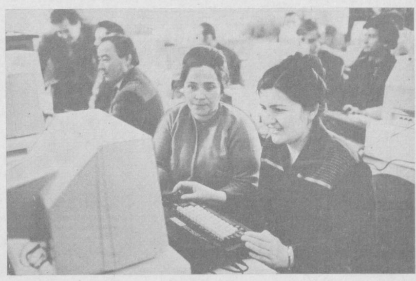
В дипломах выпускников Самаркандского государственного педагогического института им. С. Айни обозначено, что они стали школьными преподавателями не только математики, но и информатики и вычислительной техники. Особые эти дисциплины помогают установить новые помимо обычных микрокалькуляторов еще и электронно-вычислительные машины четвертого поколения «Агат». Учителя, окончившие вуз раньше и не знакомые с принципом их работы, могут восполнить этот пробел на курсах повышения квалификации, организованных в институте. Работе на дисплеях и ЭВМ преподавателей математики, директоров районных, городских школ и профессионально-технических училищ здесь обучают опытные специалисты.

Брюссель. День действий против антинародной социальной политики правительства Мартина провела молодежная организация Валлонии. В большинстве городов этого региона Бельгии прошли демонстрации молодежи различных политических тенденций в знак протеста против решения властей продлить с 6 месяцев до 1 года так называемый «сперидант» выпускников средних школ, обрекающий молодых людей на целый год лишения. Власть пошла на то с тем, чтобы искусственно сократить постоянно растущую численность армии «лишних людей»: выпускники в течение года не имеют права быть зарегистрированными в качестве лишенных заработка и получать пособия по безработице.