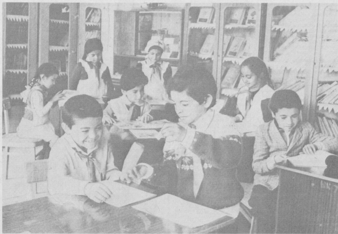
«Книжничками докторами» называют в 7 школе города Карши учеников 3 «А» класса. Они не только активно посещают школьную библиотеку, но и следят за внешним видом

И. АМОНАШВИЛИ, член-корреспондент АПН СССР, директор НИИ педагогики им. Я. С. Готбашидзе. г. Тбилиси. (На газеты «Правда»).