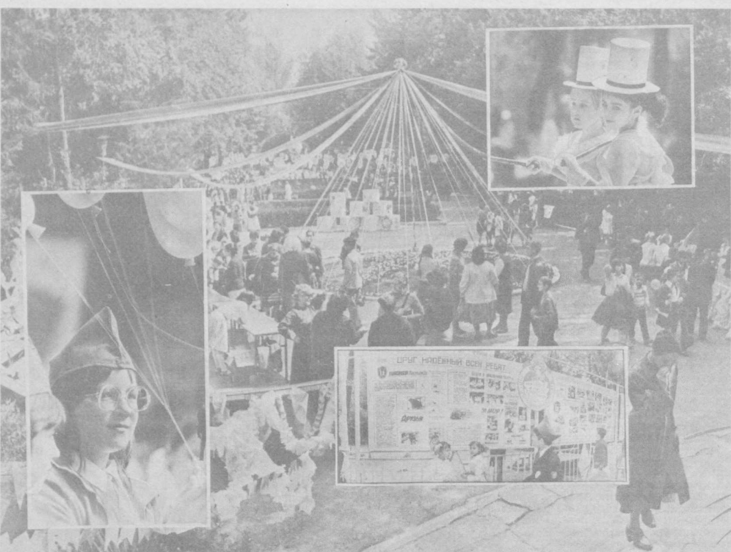
Дни пионерской печати, проведенные в Ташкенте по инициативе «Пионерской правды», проходили несколько дней и закончились большим красочным праздником в парке культуры и отдыха им. Э. Тельмана. А помогли собраться ребятам из разных уголков Узбекистана журналисты республикан-