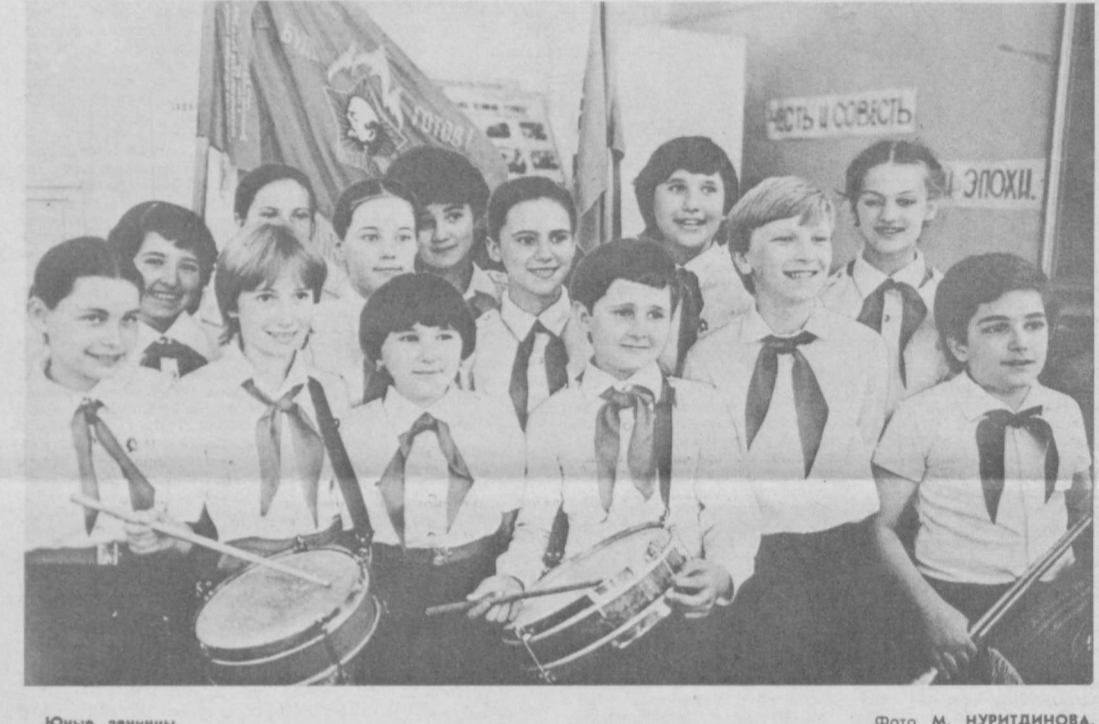
Юные ленинцы.