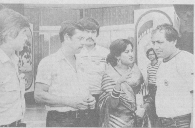
Участники и гости Ташкентского кинофестиваля.

Учитывая, что 1986 год объявлен Годом мира, в Ташкенте будет организована специальная демонстрация фильмов, посвященных миру и дружбе между народами. С участием кинематографистов стран Азии, Африки и Латинской Америки планируется создать сад мира. Все эти мероприятия отвечают девизу Ташкентского кинофестиваля — «За мир, социальный прогресс и свободу народов!».