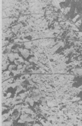
На снимке: члены бригады ухаживают за рассадой.