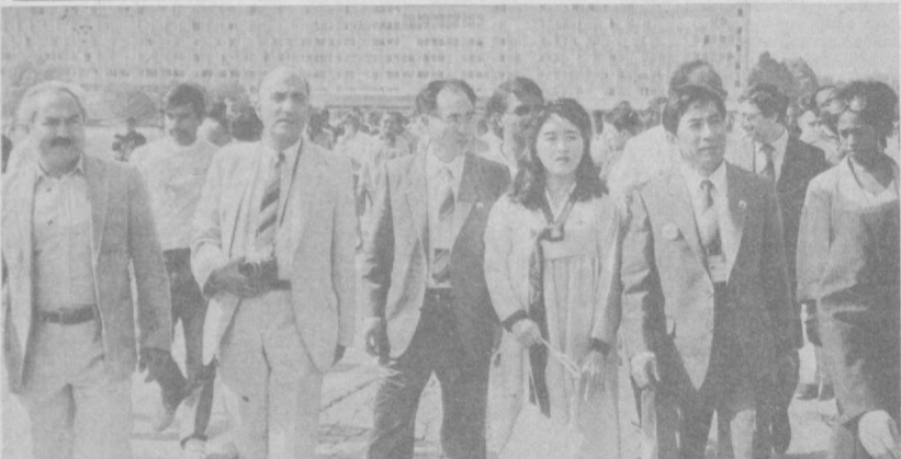
Радужно встретил Ташкент посланцев трех континентов. Нашим гостям предоставляется возможность познакомиться с жизнью столицы Советского Узбекистана, с его достопримечательностями, архитектурой и, конечно, с коллегами-кинематографистами.