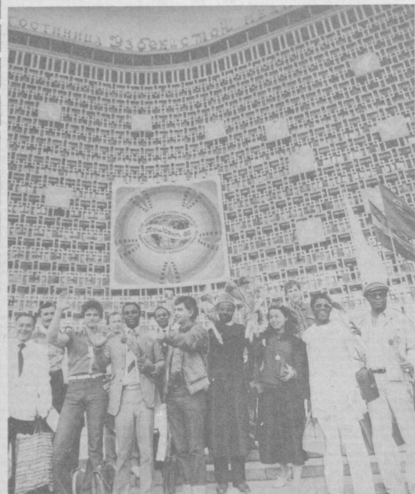
До свидания, фестиваль!