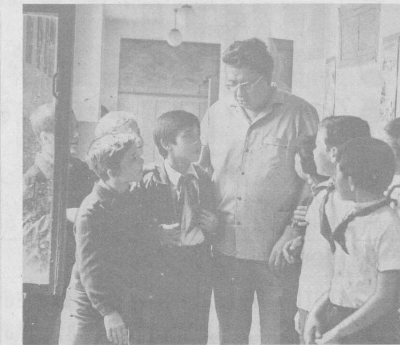
Напутствие перед канкулами.

Обращено внимание Президиума Верховных Советов союзных и автономных республик на необходимость повысить уровень работы ответственных органов государственного управления, местных Советов народных депутатов по исполнению законодательства, направленного на укрепление семьи и оказание ей всесторонней помощи, усилить их взаимодействие с общественными организациями.