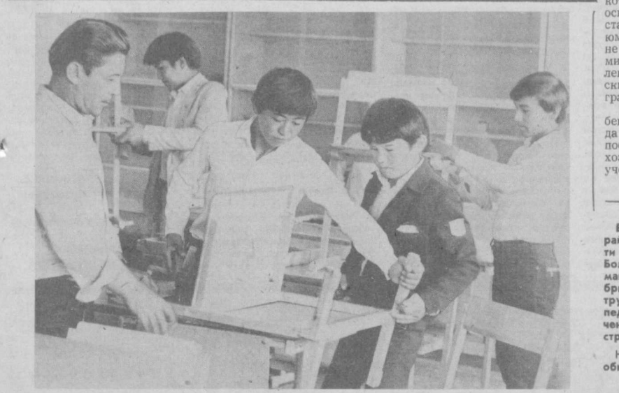
В школе № 2 Ильичевского района Сырдарьинской области в разгаре текущий ремонт. Большое участие в нем принимают ученические ремонтные бригады.