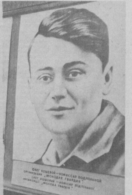
8 июня — 60 лет со дня рождения О. В. Кошевой (1926—1943), одного из организаторов подпольной комсомольской организации «Молодая гвардия», Героя Советского Союза. На снимке: О. В. Кошевой.