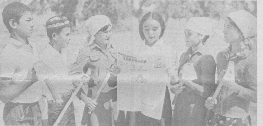
Уже не первый год работает в колхозе имени Карла Маркса Наманганской области производственная хлопководческая бригада, возглавляемая преподавателем биологии школы № 36 им. В. И. Ленина. В колхозе ребятам созданы все условия для серьезного труда и активного отдыха. На снимке: члены бригады.

Г. ВЯЛЯЛОВ, заведующий кафедрой педагогики и психологии Худземского ГПИ им. В. И. Ленина, профессор.