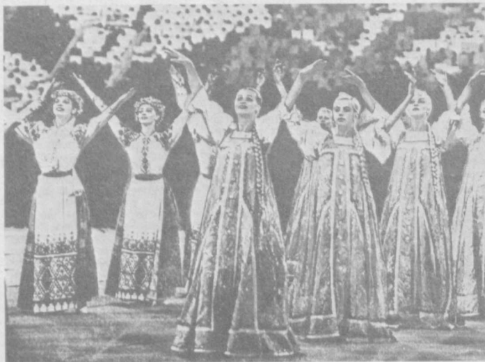
МОСКВА. Торжественное открытие Игр доброй воли на Большой спортивной арене Центрального стадиона имени В. И. Ленина в Лужниках.