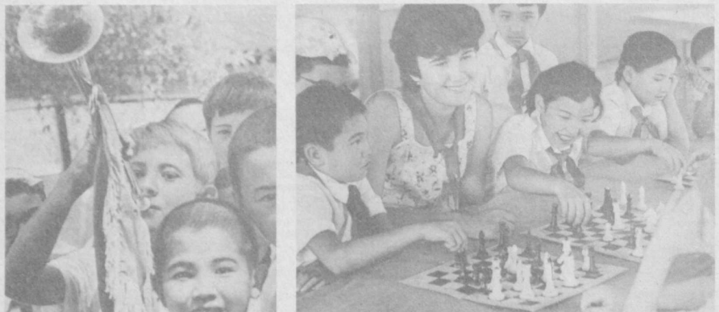
Межколхозный пионерский лагерь «Спутник», расположенный на территории совхоза «Рассвет» Калининского района Ташкентской области, уже четвертое лето принимает на отдых школьников. В этом году территория лагеря расширилась, здесь построен новый бассейн, оборудована спортивная площадка, вступила в строй замечательная столовая.