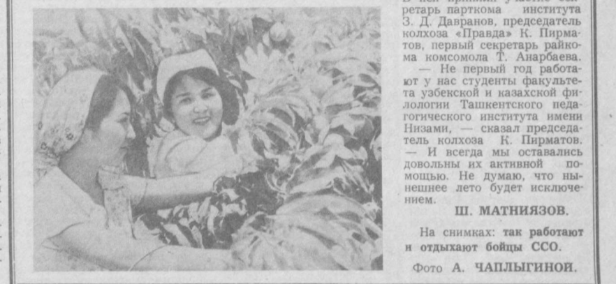
На снимках: так работают и отдыхают бойцы ССО.