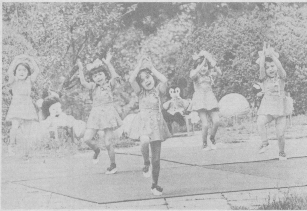
«Мы танцуем и поем!».