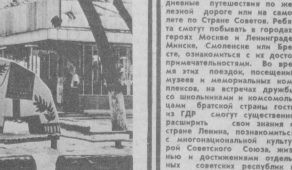
На снимках: новое кафе-мороженое в Янгйуле; Детская площадка перед «Лесной сказкой».

Л. ЛАВРИНА , редактор городской газеты «Алматынский рабочий».