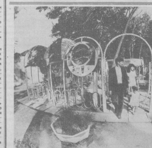
Сразу несколько молодежных безалкогольных кафе открылось летом в городе Янгйуле. Здесь уютно, посетителям созданы все условия для интересного отдыха, предлагается большой ассортимент прохладительных напитков, прижизненных кофе.

С этим опытом с большим интересом ознакомились участники открывшегося в Навон республиканского совещания по организации досуга молодежи.