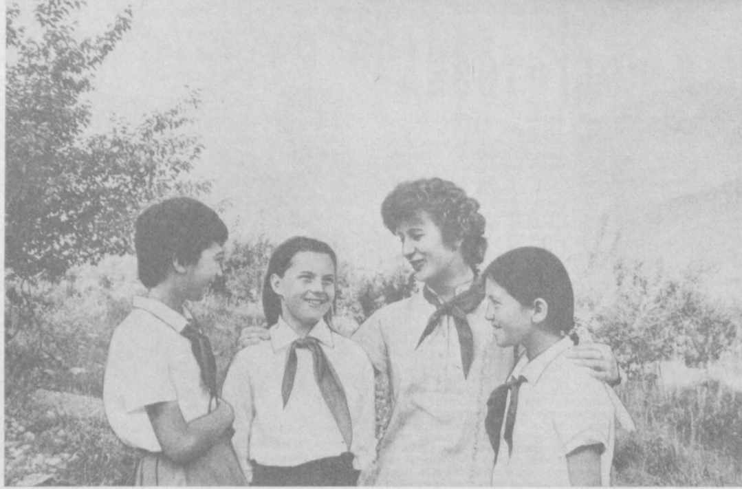
Занятия спортом, увлекательные походы, интересно организованный досуг помогают ребятам, отдыхающим в пионерском лагере «Горный», окрепнуть и набраться сил к началу нового учебного года. Здесь проводят каникулы дети рабочих и служащих ферганского производственного объедине-

Экспозиция собрана по просьбе читателей библиотеки. (Корр. УзТАГ)