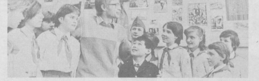
Пионерская дружина ленинской средней школы № 403 носит имя Э. Тельмана. Но только в течение всего учебного года, но и во время летних каникул ребята собирают материалы о жизни и деятельности пламенного революционера — интернационалиста Э. Тельмана. Самые интересные из них экспонируются в школьном музее.

УЧИТЬСЯ водить автомобиль, работать с современной техникой, совершать длительные марш-броски будут мальчишки многих школ Архангельской области. А помогут им в этом опытные педагоги-специалисты. В педагогическом институте состоялся первый выпуск преподавателей начальной