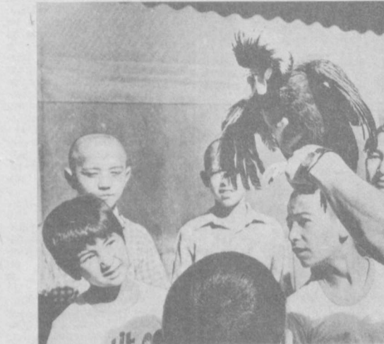
Для наших «сверхурбанизированных» детей, приносящих к красоте природы в лучшем случае восхристанья за городом, а чаще всего только посредством кино и цветных картинок, станции и кружки юных натуралистов имеют особенно важное значение.

Эти хорошо понимают работники Республиканской станции юных натуралистов в Ташкенте. Здесь дети имеют возможность не только общаться с любимыми животными, но и изучать их вкусы, повадки, постигать тайны интересной науки — зоопсихологии.