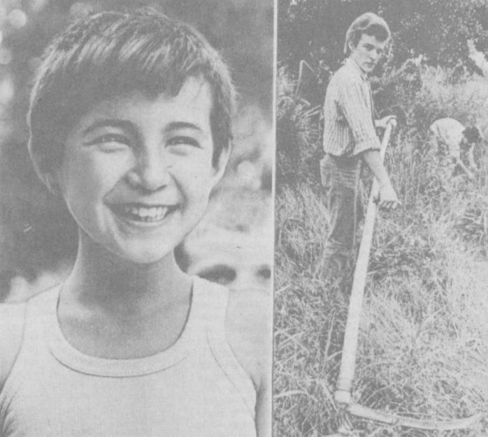
Воспитанники Маргиланского детского дома с пользой проводят летние месяцы в лагере труда и отдыха, расположенном в их подсобном хозяйстве. Работа сами косят траву в футбол, в волейбол, а в свободное время играют в футбол, в волейбол, в теннис.