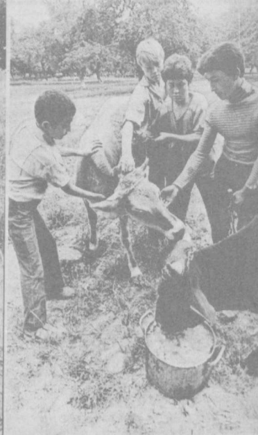
На снимках: так проходит лето в детдомовском ЛТО.