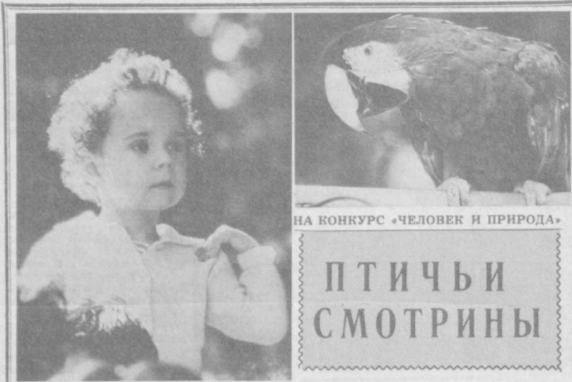
НА КОНКУРС «ЧЕЛОВЕК И ПРИРОДА»