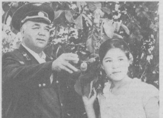
ЗАВТРА — ДЕНЬ РАБОТНИКОВ ЛЕСА

Сочетая теорию с практикой, студенты примут участие в создании компьютеров, их внедрении в производство, получат навыки применения робототехники в различных отраслях народного хозяйства.