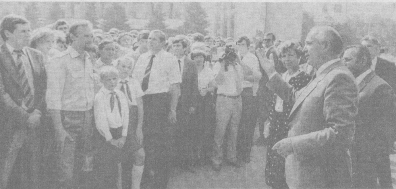
Во время встречи М. С. Горбачева с жителями Краснодара.

Встречи М. С. Горбачева с трудящимися Краснодарского и Ставропольского краев