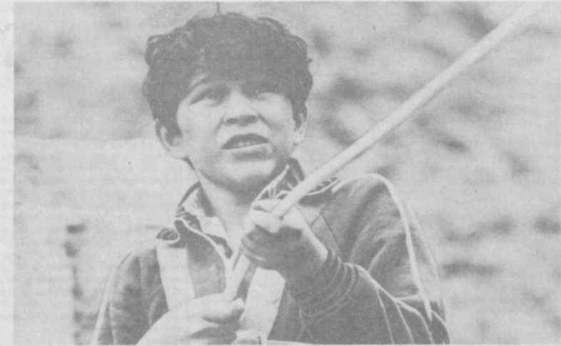
Недавно Ташкентская городская станция юных туристов провела в Чимгане соревнования по технике горного туризма, в котором приняли участие многие школьники Ташкента. На снимке: юные туристы продемонстрировали удивительную ловкость и физическую выносливость.