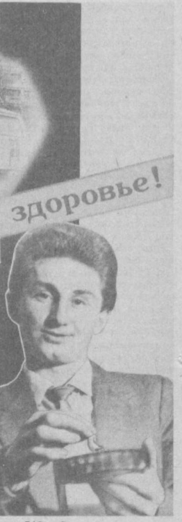
тво В/О «Союзторгкляма»