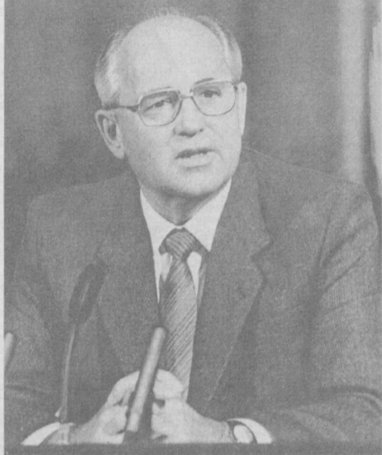
Во время пресс-конференции.