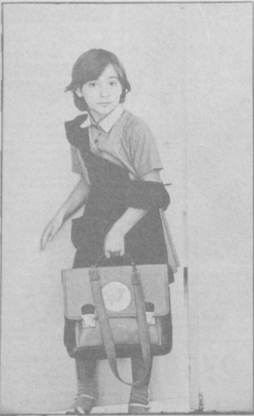
Слоздала... Фотоэтид В. СВЕРИДОВА.