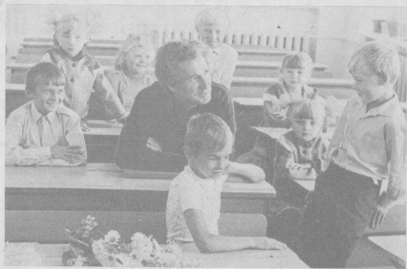
Хороший подарок получила детвора села Чекнуво, одного из отделений совхоза «Скитинский», — новую школу и детский сад. Они построены под одной крышей. Вокруг оборудованы спортивные площадки, уголки для учебной и внеклассной работы.