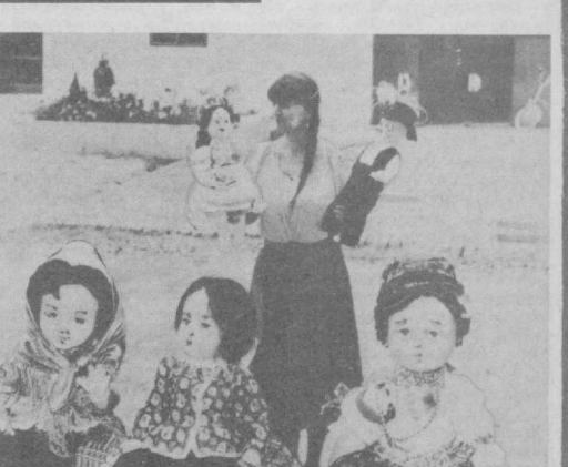
ВЕНГРИЯ. Симпатичные куклы, экспонировавшиеся недавно в Доме молодежи Хатвана, не предвещают особый интерес для взрослых...