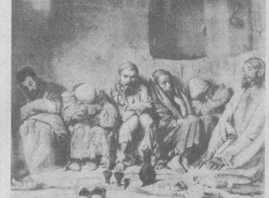
На снимке: фотопроизведение картины В. В. Верещагина «Оплунмурды».

Ф. ШЕВНИКОВ, сотрудник Государственного музея искусств УзССР.