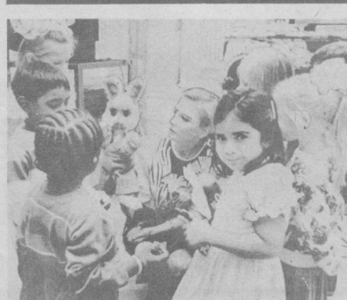
США. В посольстве СССР в Вашингтоне состоялась встреча советских и американских детей с популярными ведущими детских телепередач...