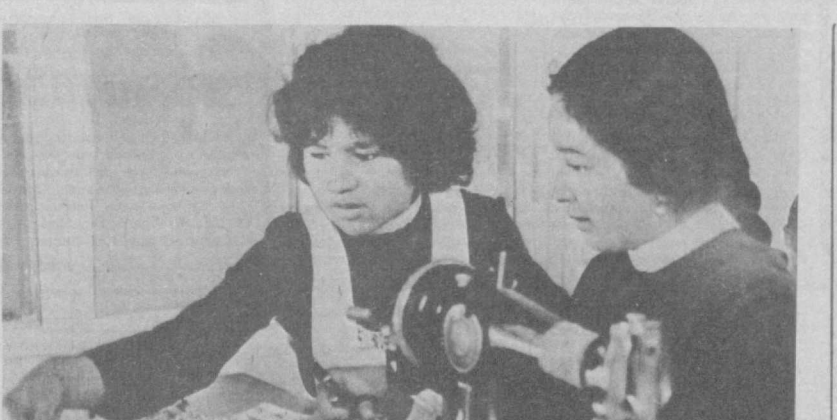
УПК № 3 — самый молодой учебно-производственный комбинат в Калининском районе Ташкентской области; это всего лишь третий учебный год в его истории. Состоялся уже первый выпуск — несколько десятков ребят получили свидетельства о присвоении им квалификации трактористов общего профиля, лекарей, овощеводов, продавцов, швей-мотористок. В следующем учебном году открылись новые группы — садоводов.