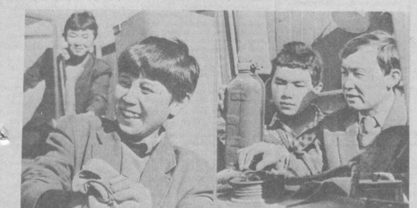
УПК № 3 — самый молодой учебно-производственный комбинат в Калининском районе Ташкентской области; это всего лишь третий учебный год в его истории. Состоялся уже первый выпуск — несколько десятков ребят получили свидетельства о присвоении им квалификации трактористов общего профиля, лекарей, овощеводов, продавцов, швей-мотористок. В следующем учебном году открылись новые группы — садоводов.