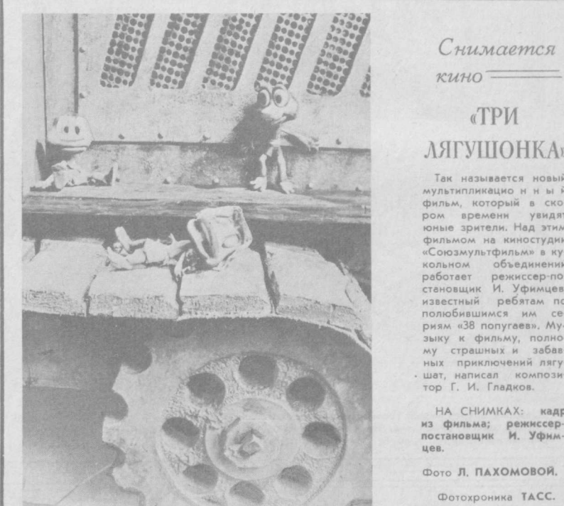
Снимается кино «ТРИ ЛЯГУШОНКА»