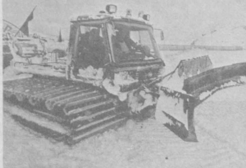
Снежный покров укрыл горы Чимгана, одно из самых живописных мест Узбекистана. Но встреча гостей, любителей горнолыжного спорта, требует тщательной подготовки. Пер-