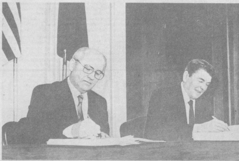
Во время подписания Договора.

понятиях о нравственности между нашими странами сохраняются серьезные и основополагающие различия. Однако сегодня, по крайней мере, по этому жизненно важному вопросу мы видим, чего можно добиться, когда мы вместе тянем в одном направлении. Один лишь цифры подчеркивают важное значение этого соглашения: у советской стороны более 1.500 развернутых боеголовок будет снято с ракет, и